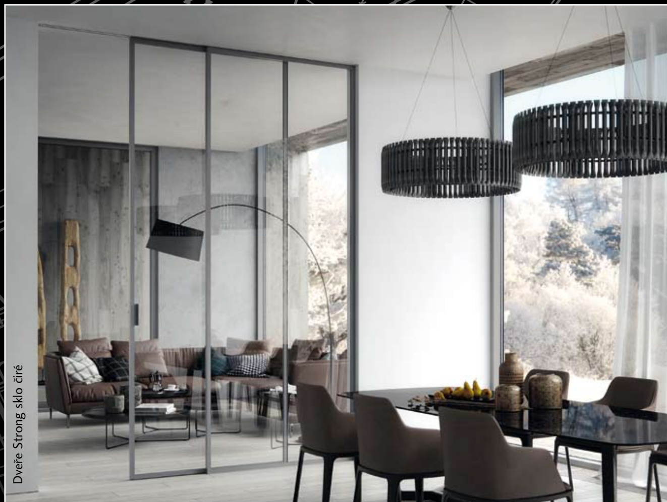
Dveře Strong sklo číré