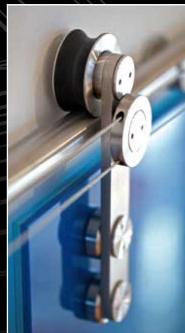
Detail synchronu Rolla.