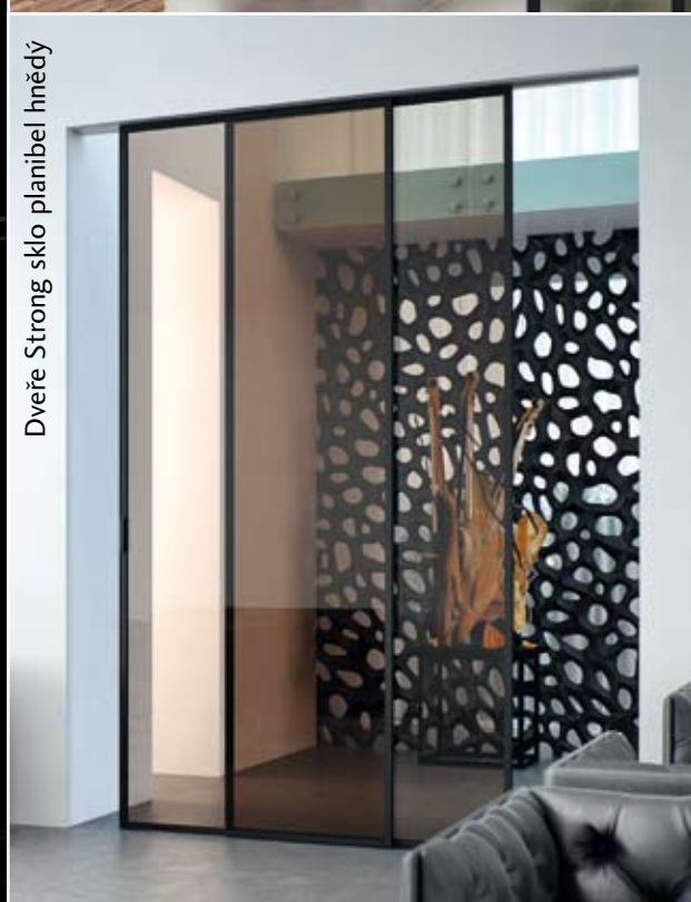
Dveře Strong sklo planibel hnědý