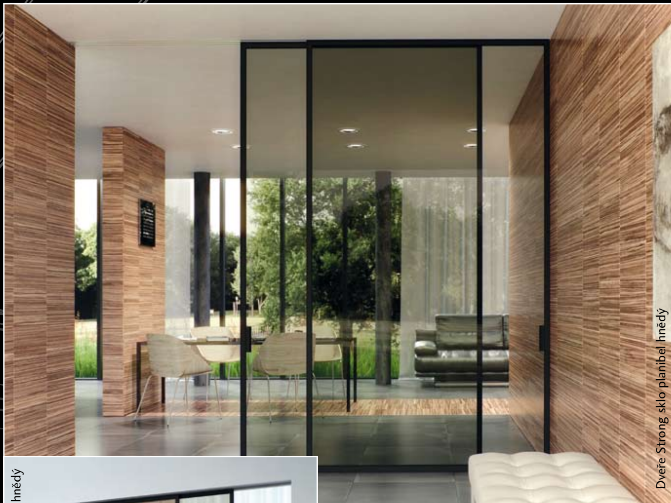
Dveře Strong sklo planibel hnědý